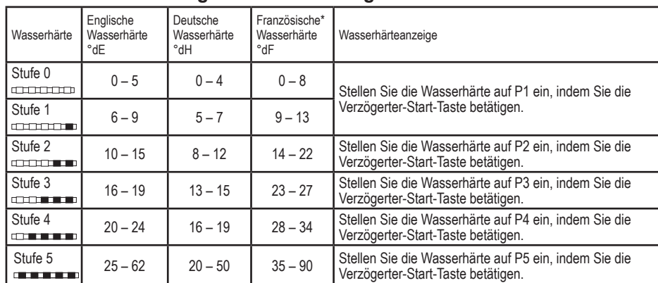
Tabelle zur Einstellung des Wasserhärtegrades